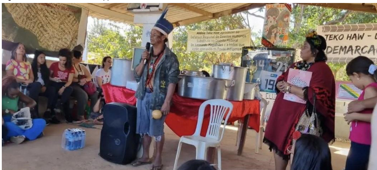
Figura 2 – Visita à aldeia Teko Haw Guajajara no Setor Noroeste de Brasília, DF

Fonte: Arquivo pessoal de Renata Nogueira da Silva (2023).