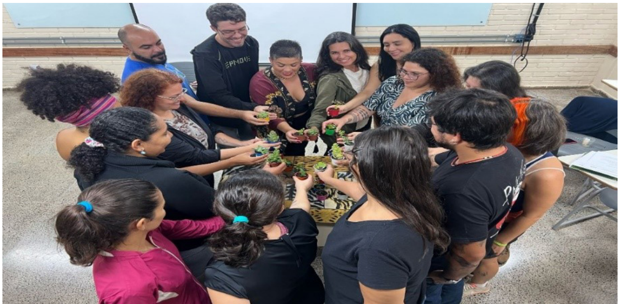
Figura 3 - Início das atividades do curso Saberes e fazeres indígenas, africanos e afro-brasileiro e suas potencialidades educativas