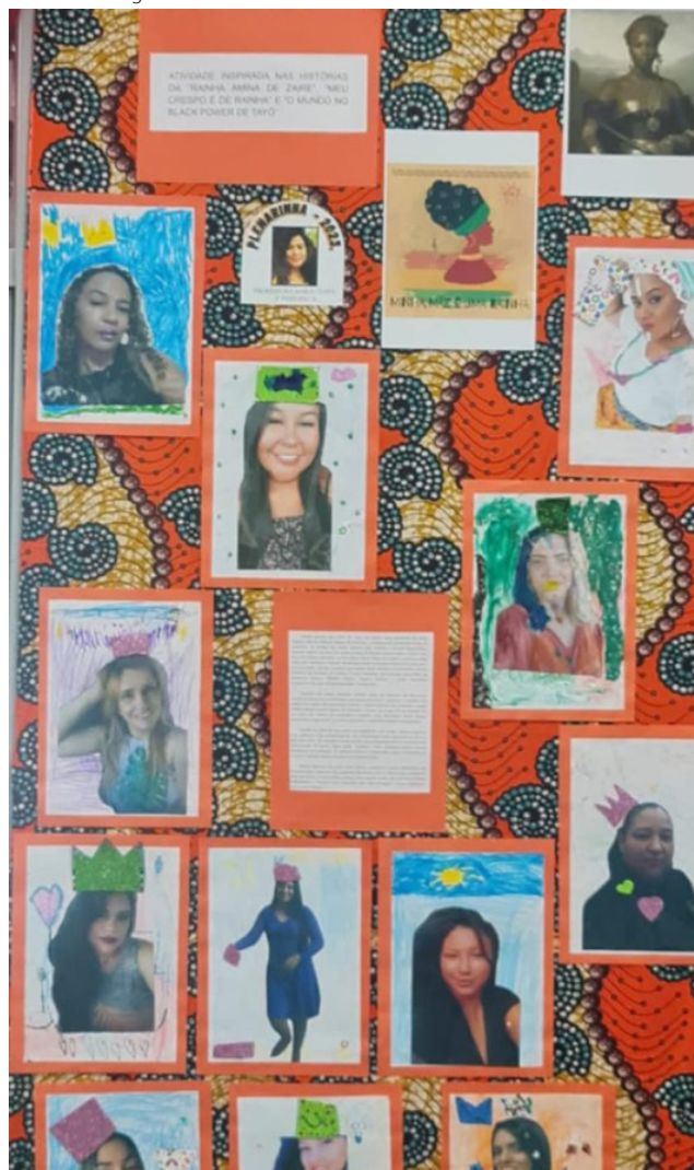
Figura 1 - Painel da atividade “Minha mãe é uma Rainha!” exposto na Plenarinha Regional de Planaltina – 2023