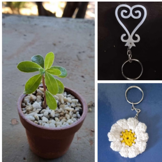
Figura 4 - Presentes recebidos no início de cada curso: aprender com o passado, cultivar, florescer