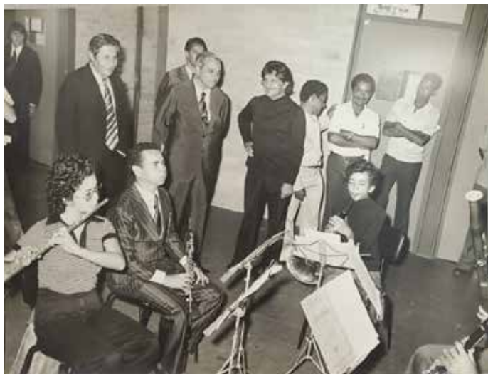
Escola de Música - 1974